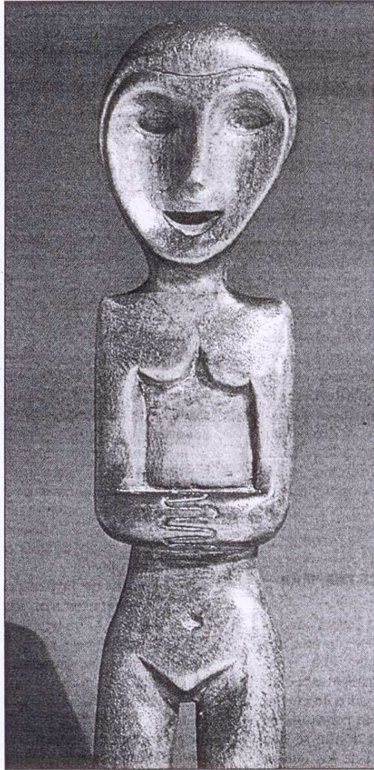
Escultura que se mostrará en el Museo Antón de Candás.

Otro de los atractivos de la exposición, que reunirá unas 35 obras entre óleos, gouaches y bocetos, estará en la pieza que servirá como cartel anunciador: un exquisito gouache de 1938,