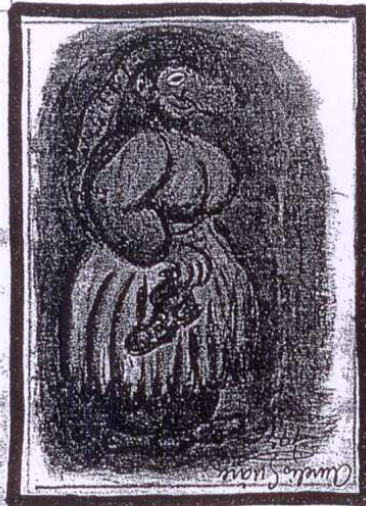
'MASCARITA'. Gouache, tinta y lápiz sobre papel, 1976.