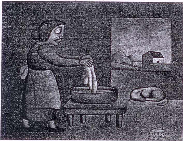
'LAVADORA DOMÉSTICA'. Óleo sobre lienzo, 1964.