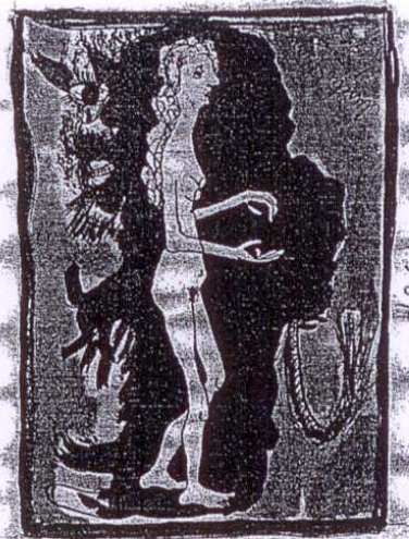
'MUJER A LA SOMBRA DEL DIABLO'. Gouache, tinta y lápiz sobre papel, 1953.