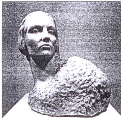
A la derecha, escultura titulada 'Madre jugando con niño', 1930. A la izquierda de estas líneas, otra de las obras denominada 'Victoria', 1923.